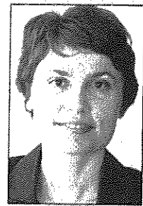
Της Μαρίας Μανιαδάκη*

Η Νήσος του Πάσχα είναι ένα από τα πιο απομακρυσμένα κατοικημένα μέρη του πλανήτη. Έχει έκταση 150 τετραγωνικά μίλια περίπου και βρίσκεται στον Ειρηνικό Ωκεανό. Ο πληθυσμός της έφτασε στην ακμή του τους 7.000 κατοίκους. Πρόκειται για έναν λαό που ξεκίνησε γύρω στον 5° αιώνα μ.Χ με πολύ περιορισμένους φυσικούς πόρους και οικοδόμησε μια από τις πιο προηγμένες κοινωνίες. Μετά το